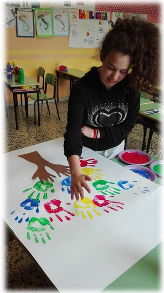
Dalla loro voglia di essere ascoltati, di fare e di creare